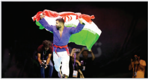
سیزدهمین دوره مسابقات کوراش قهرمانی آسیا