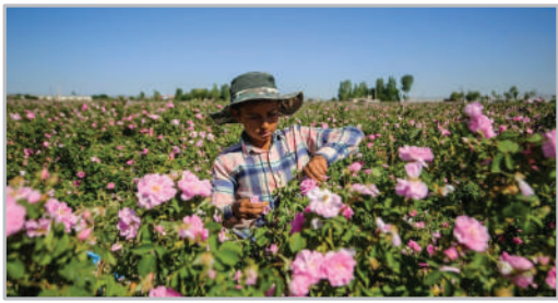
برداشت گل محمدی از مزارع استان همدان