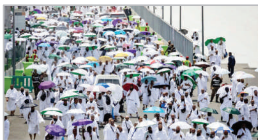
ورود حجاج به چادرهایشان - صحرائی منا