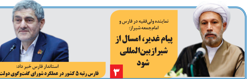
نماینده ولی فقیه در فارس و امام جمعه شیراز: پیام غدیر، امسال از شیراز بین المللی شود

استاندار فارس خبر داد: فارس رتبه ۵ کشور در عملکرد شورای گفت و گو دولت و بخش خصوصی