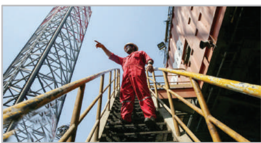
مردان آهنین در قلب خلیج فارس