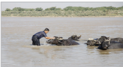
منطقه گاومیش آباد - اهواز